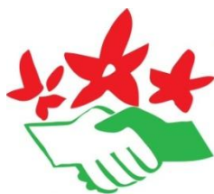
NATURFREUNDE AMIS DE LA NATURE NATUREFRIENDS INTERNATIONAL