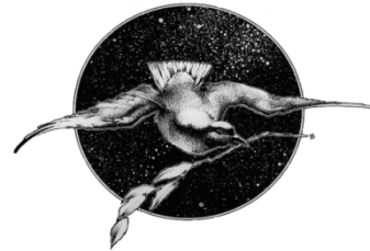
Global Network Against Weapons and Nuclear Power in Space