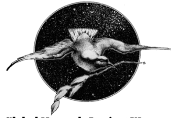
Global Network Against Weapons and Nuclear Power in Space